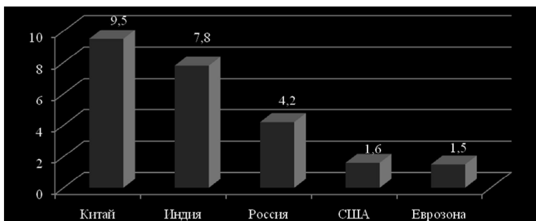
Рисунок 2 - Темп роста ВВП ведущих экономик мира в 2011 г., в %

Достигнутые успехи в первую очередь обусловлены тем, что Россия выглядит привлекательнее ряда стран с точки зрения макроэкономической стабильности. Уже несколько лет подряд темпы роста ВВП страны держатся на уровне свыше 4%. В 2011 году по росту ВВП (4,2%) Россия заняла 3 место среди ведущих экономик мира, пропустив вперед только Китай (9,5%) и Индию (7,8%). Рост внутреннего валового продукта в еврозоне в целом составил 1,5%, в США – 1,6% (рис. 2) [5].