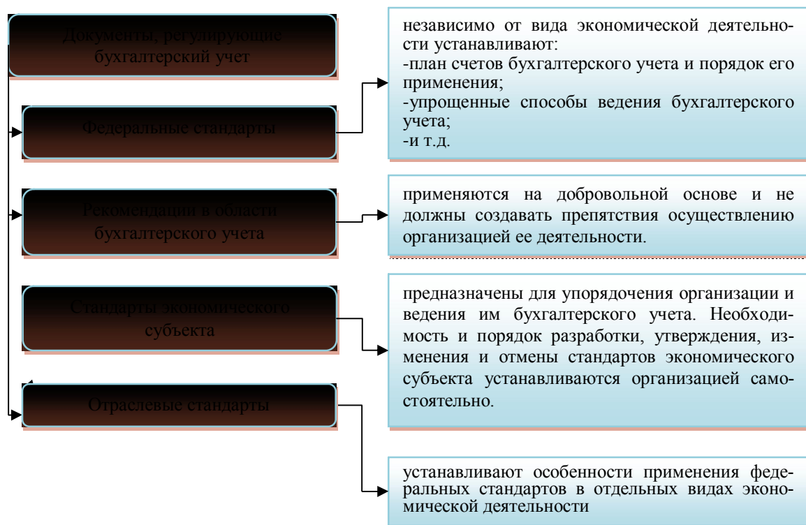
Рисунок 2 - Документы, регулирующие бухгалтерский учет

Для чего предназначен и что устанавливает каждый вид документов, регулирующих бухгалтерский учет, представлено на рисунке 2.